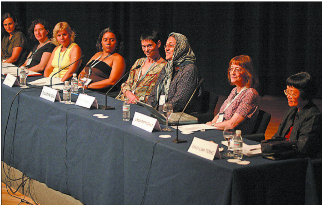
Matemáticas de distintos países, en un acto del congreso internacional celebrado en agosto.

Las mujeres son casi el 60% de los nuevos licenciados en España, pero sólo ocupan el 9% de las cátedras universitarias